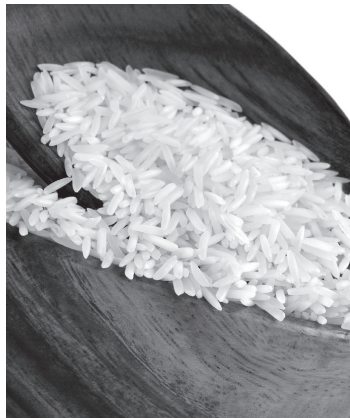
سرانه برنج وجود دارد؟

با حل معضل!! مصرف سرانه واقعی، با در دست داشتن میزان تولید - قریب به یقین - یافتن میزان نیاز وارداتی مشکل نخواهد شد. مشروط بر اینکه، به مدیران استانی اعتماد کامل داشته باشیم و آمار تولید اعلام شده آنها را واقعی بدانیم و در اعلام آن توسط مدیران ستادی در تهران، دستخوش تغییر نکنیم. با مروری بر آمار میزان تولید برنج در کشور و در سالهای گذشته و میزان مصرف سرانههای متعدد اعلام شده، بارها و بارها رقم نیاز ۶۰۰-۷۰۰ هزار تن واردات برنج اعلام شده است. اگر حداقل و حداکثر مصرف سرانه اعلام شده و حداقل میزان تولید داخلی برنج را مدنظر قرار دهیم، میزان به واردات بین ۶۰۰-۸۰۰ هزار تن نوسان داشت (مگر با آمار اخیر که حداقل تولید داخلی و حداکثر مصرف سرانه را تأیید نموده!!) خوب، وقتی در سال ۱۳۹۲ - به رغم ذخیرههای قبلی - رقم واردات به ۱,۹۶۰,۰۰۰ تن می‌رسد و در پنج ماهه اول سال ۱۳۹۳ نیز رقم ۶۶۰,۰۰۰ تن به آن افزوده می‌شود، یعنی وجود ۲,۶۲۰,۰۰۰ تن برنج وارداتی در کنار ۲,۳۰۰,۰۰۰ تن (و یا کمتر!) بگوئیم